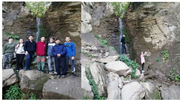
рис. 10, 11. У водопада Шарлама

Поблизости от озера Асылыкуль (в четырех километрах от него), за деревней Бурангулово, находится интереснейшая туристическая достопримечательность Башкирии — водопад Шарлама . «Шарлама» так и переводится – «водопад», «поток». Высота падения воды – 12 метров. При желании тут можно прекрасно освежиться, приняв холодный душ. Водопад Шарлама находится близ дороги, идущей от Бурангулово до деревни Пыжьяновка. У водопада есть площадка для отдыха туристов, беседка. Здесь прошла первая ночевка группы. Изобилие трав, лесных ягод (смородина, дикая вишня, малина, земляника), чистая вода.