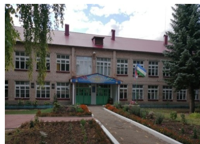
рис.12. СОШ с.Ивановка