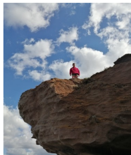
Рис.17. Скалы Асылыкуля