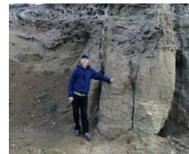
рис. 6,7,8,9. У горного Мякашевского массива