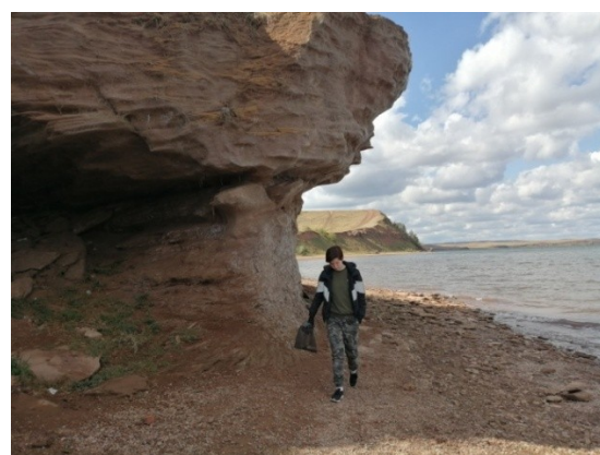
Рис.18. У озера Асылыкул