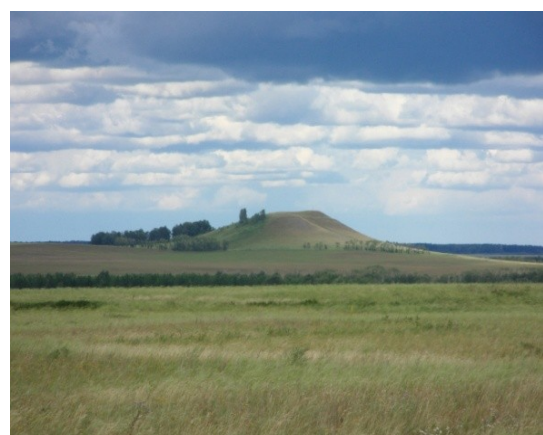
рис. 4,5. Гора Балкан – Тау