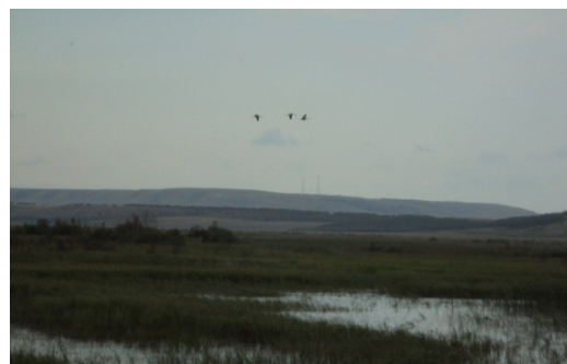
Рис.19, 20. Болото Берказан