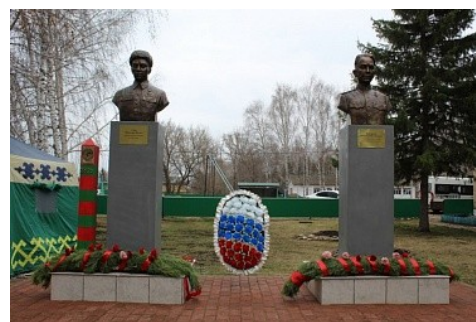
рис.13.памятник В.И.Утину и Н.М.Бусаргину