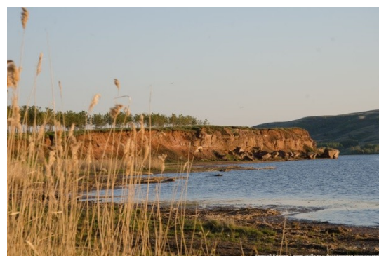
Рис.16. Озеро Асылыкул