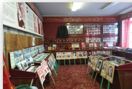
14. Школьный музей с.Ивановка