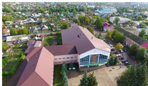
рис. 1. город Давлеканово